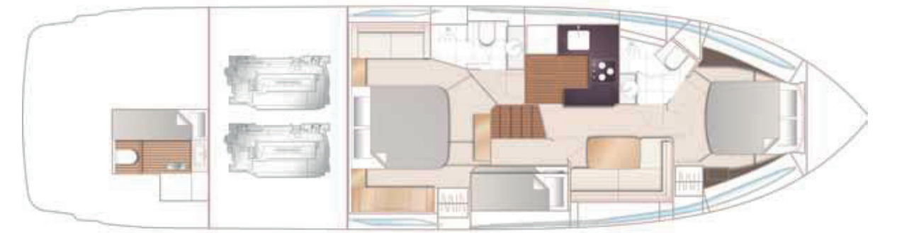
ОТКРЫТАЯ ГЛАВНАЯ ПАЛУБА